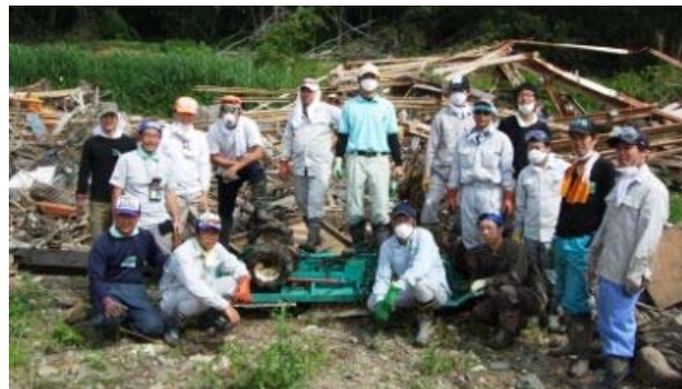
《静岡県の支援隊参加者》

平成23年3月11日に発生した東日本大震災による被害に対し、義援金や支援物資の提供を行うとともに、被災地へのボランティア活動として、JAグループ支援隊に対して本会職員を派遣しました。