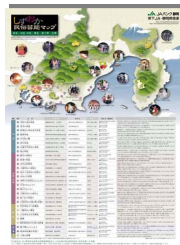
《しずおか民俗芸能マップ》

今後も私たちは、民俗芸能の保存・伝承活動に取り組む団体や個人の皆様に対する助成活動を通し、地域文化活動を支援します。