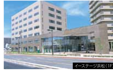
③ 浜松支店 〒430-0929 浜松市中区中央一丁目2番1号 TEL.053-453-0121