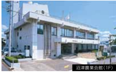
① 沼津支店 〒410-8544 沼津市三芳町2番1号 TEL.055-962-0450