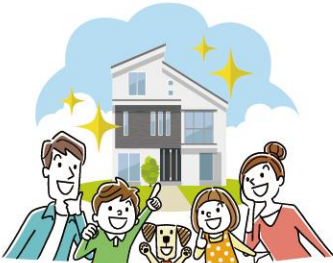
JA住宅ローン (新築・借換)