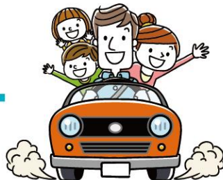
他金融機関等のローン (700万円まで)