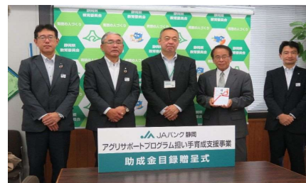
《 令和3年8月3日 静岡県教育委員会にて》