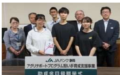
《 令和3年7月28日 県立農林環境専門職大学にて》