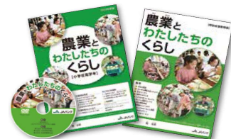
《農業とわたしたちの暮らし》

また、ユニバーサルデザインの考えに基づいた「特別支援教育版」も制作し、特別支援学校や特別支援学級に贈呈しています。