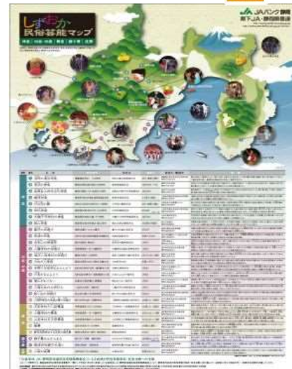
《しずおか民俗芸能マップ》

また、静岡県内各地の国・県指定の無形民俗文化財保護団体を掲載した「しずおか民俗芸能マップ」を作成しています。