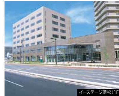
● 浜松支店 〒430-0929 浜松市中区中央一丁目2番1号 TEL.053-453-0121