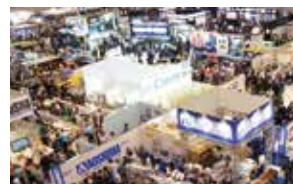
静岡ホビーショー

多く訪れる国際的なイベントとして注目を集めています。模型ファンにとって「聖地」となった静岡。これからも進化と成長が期待されています。