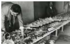
第一回生産者見本市

静岡市は、国内シェア80%を誇るプラモデルの聖地です。その歴史は長く、家康公の時代に全国から優秀な職人が集まったことで木工産業が発展し、その匠の技がプラモデル産業の源流である木製模型産業に受け継がれました。戦前は木製模型飛行機で大きく発展、戦後は木製艦船模型で人気を博しました。昭和35年に国産プラモデルが初めて発売されると、静岡の模型メーカーもプラモデルへと転換を図り、その後、マンガやテレビのキャラクターモデルという新ジャンルを開拓し、各メーカーから個性豊かな商品が続々と誕生しました。昭和34年に始まった「生産者見本市」は「静岡ホビーショー」へと形を変え、海外バイヤーも数